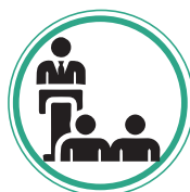
RENDICIÓN DE CUENTAS