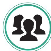
COMITÉS DE USUARIOS